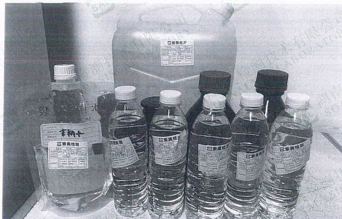
新田县自来水公司 (曾山水厂管网末梢水)